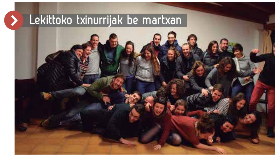
Lekittoko txinurrijak be martxan

> Ezker Abertzale mailan emondako Abian prozesuaren ondorioak gazte antolakundearen implementatzea. Askapen prozesuaren birtute nagusia historikoki be hori izan da, erakunde ezberdinen arteko koheretia.