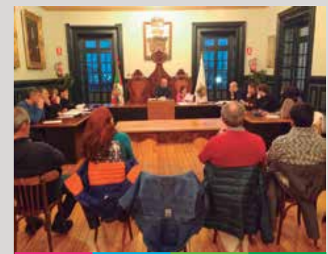
Parte hartze ordenantza

Aurreko legegintzaldian ondare izendatzea lortu zan, eta horrek, besteak beste esan nahi dau, espazio hori herriarentzako ekipamendu moduan erabili behar dala. Pribatizatu eta goi mailako hotel bihurtzeko proiektuak geldiarazita.