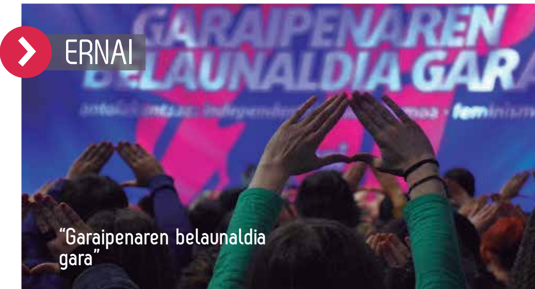
"Garaipenaren belaunaldia gara"

Ernai gazte antolakundiak lau urte bete barri, "Inurritegia" prozesua burutu barri dau aurtengo ikasturtian. Inurritegia da prozesuari ipini dien izena eta Zirtaka" eztabaidagai izan daben txostenarena. "Garaipenaren belaunaldia gara" lempian ospatu dabe prozesu amaierako kongresua.