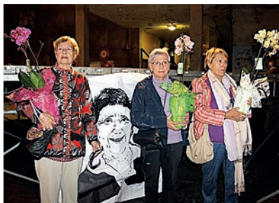
BITXOREREN OMENALDIAN (2014)