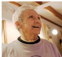
IBILDIKO BIDEOKLIPA (2022)