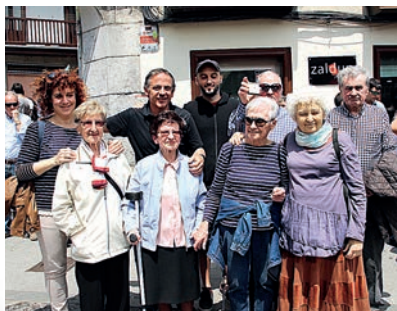
OHZ KIDEAK (2018)