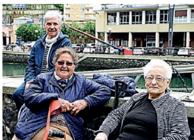
ANTXOA EGUNEAN (2018)